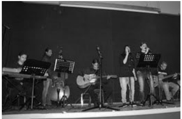
Οι μαθητές του Μουσικού Σχολείου Αμυνταίου έδωσαν και μια μουσική παράσταση.