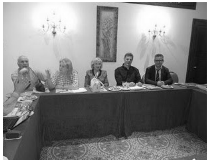
Φωτογραφίες από την 8η Συνάντηση των Ενώσεων Καταναλωτών στη Βόρεια Ελλάδα.