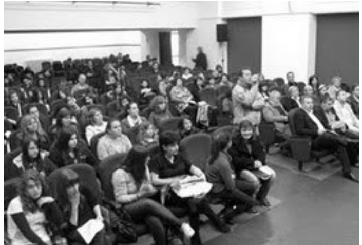
Αποψη από την εκδήλωση.