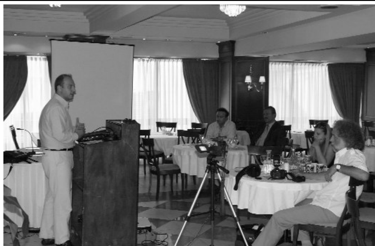
Φωτογραφία από την Ημερίδα για Θέματα Καταναλωτή, Φλώρινα, 7 Σεπτεμβρίου 2008. Στο βήμα ο Γενικός Γραμματέας Καταναλωτή του Υπουργείου Ανάπτυξης, κ. Οικονόμου Ιωάννης.