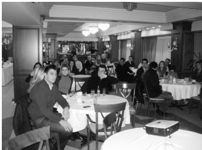
Άποψη από την εκδήλωση, η οποία κράτησε αμείωτο το ενδιαφέρον του κοινού.