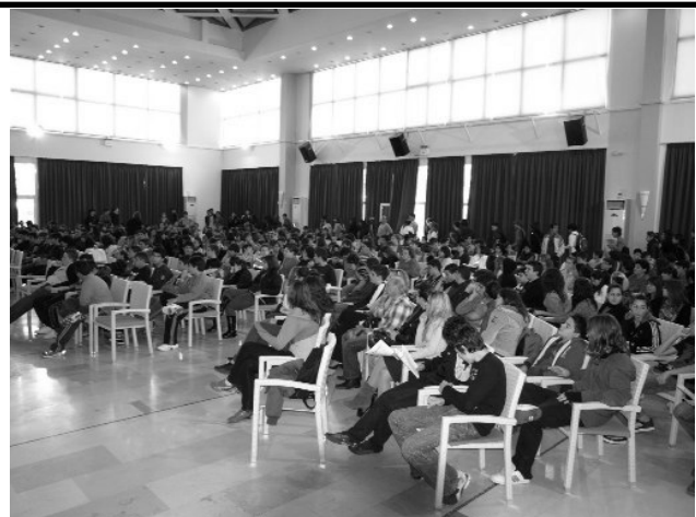
Φωτογραφία από την Ημερίδα της Ομάδας DART στη Ρόδο, την Πέμπτη 20 Νοεμβρίου 2008, που έγινε σε συνεργασία με το Πανεπιστήμιο Αιγαίου και το ΚΕ ΠΛΗ.ΝΕ.Τ. Ν. Δωδεκανήσου.

Ελληνική Καταναλωτική Οργάνωση (Ε.ΚΑΤ.Ο.) Φλώρινας Ι. Καραβίτη 2 - Κτίριο "ΔΙΕΘΝΕΣ" 531 00 Φλώρινα